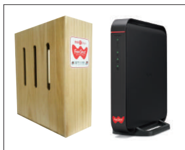
FREE Wi-Fi(Spot) 導入キット