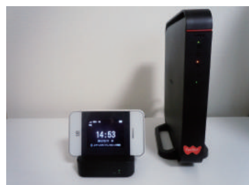
オプション モバイルデータ通信端末